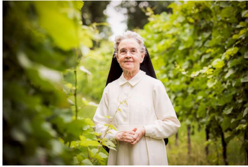
Mens en natuur: in de wijngaard