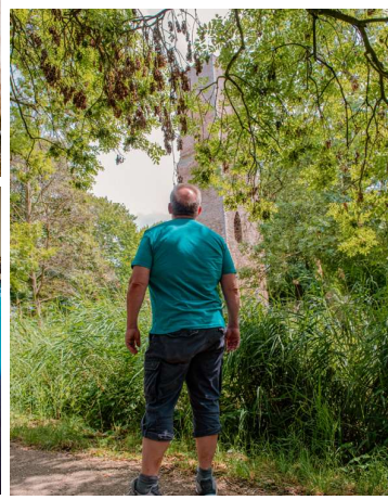
Hittestress: verdrogen, verkoelen, vertragen